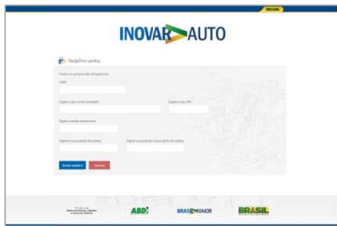
Figura 1: Tela de redefinir senha

Ao receber o e-mail com o link para o acesso inicial, o responsável da matriz da empresa deve seguir as orientações para redefinir a senha de acesso (Figura 1), descritas no e-mail. Em seguida, na tela de login (Figura 2), o usuário deve informar a senha definida para acessar o sistema.