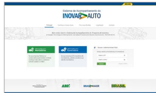
Figura 2: Tela de login

No primeiro acesso ao sistema é obrigatório completar o cadastro da empresa (Figura 3) antes de continuar a navegação no sistema. Sem o preenchimento do cadastro não é possível acessar o sistema. O cadastro compreende 3 grupos de informações: